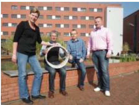
Expertteam Verlengen levensduur

Expertteams zijn aan het werk gegaan. Er wordt zoveel mogelijk projectmatig gewerkt zodat taken en verantwoordelijkheden duidelijk zijn. Door de Regiegroep zijn formats opgesteld voor de 'opdracht', het 'plan van aanpak' en de afronding van een product.